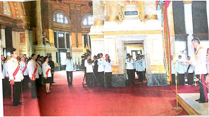
หนังสือพิมพ์คุณภาพ เพื่อคุณภาพของประเทศ

จำคุก'สนธิ' ลืมทวงกลพร้อมพวก 85 ปี ฐานผิด พร.บ.หลักทรัพย์ แต่งบัญชี (อ่านต่อหน้า 11)